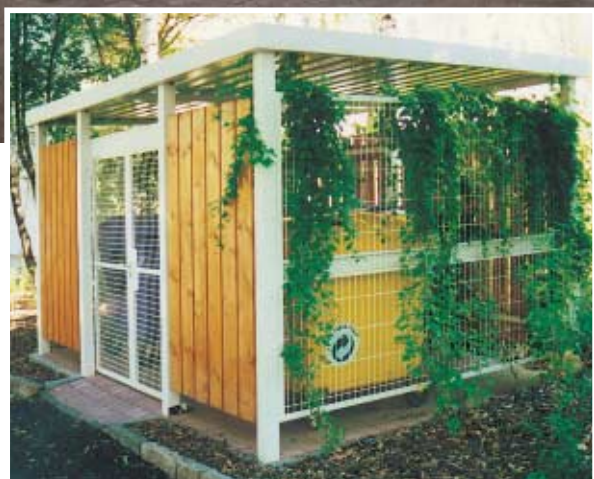
▲ Abb. Einhausung VIELFALT für Müllcontainer und Fahrräder, mit Stahlblech-Paneeeln, pulverbeschichtet in RAL 7001 silbergrau, abschließbar mit 2-teiliger Flügeltür, vorbereitet zum Einbau eines Schließzylinders.